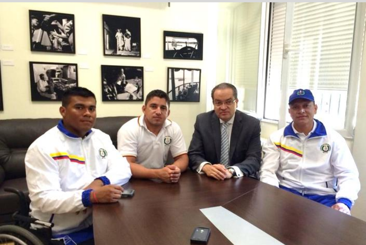
Embajador Fernando Carrillo, junto a los tres miembros del seleccionado colombiano de Paracycling.

Madrid, 28 de julio 2014. Tras culminar una destacada participación en la Copa Mundo de Paraciclismo de Segovia, el seleccionado nacional Manzana Postobón de Paracycling visitó al Embajador de Colombia en España, Fernando Carrillo Flórez.