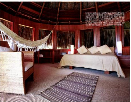
Si lo que se busca es el Parque Nacional Tayrona es una experiencia ecológica integrada de alojamiento con el entorno de un hotel de lujo que conviva con el medio ambiente, ofrece la experiencia de la naturaleza y a través de la vida silvestre, ofrece a los viajeros una de las piezas de este espacio integrado.

"Colombia es el único país sudamericano que se asoma al Pacífico y al Caribe y, además, se extiende hasta el Amazonas. Por eso, la diversidad de ecosistemas que ofrece es apabullante. Uno de los más singulares es el Parque Nacional Tayrona, donde se puede disfrutar de la experiencia de pasar la noche en este espacio de naturaleza excepcional", afirma el reportaje de cuatro páginas en el que se alaba también la originalidad de los paisajes del Parque, que exhibe la montaña nevada más alta del mundo al lado del mar.