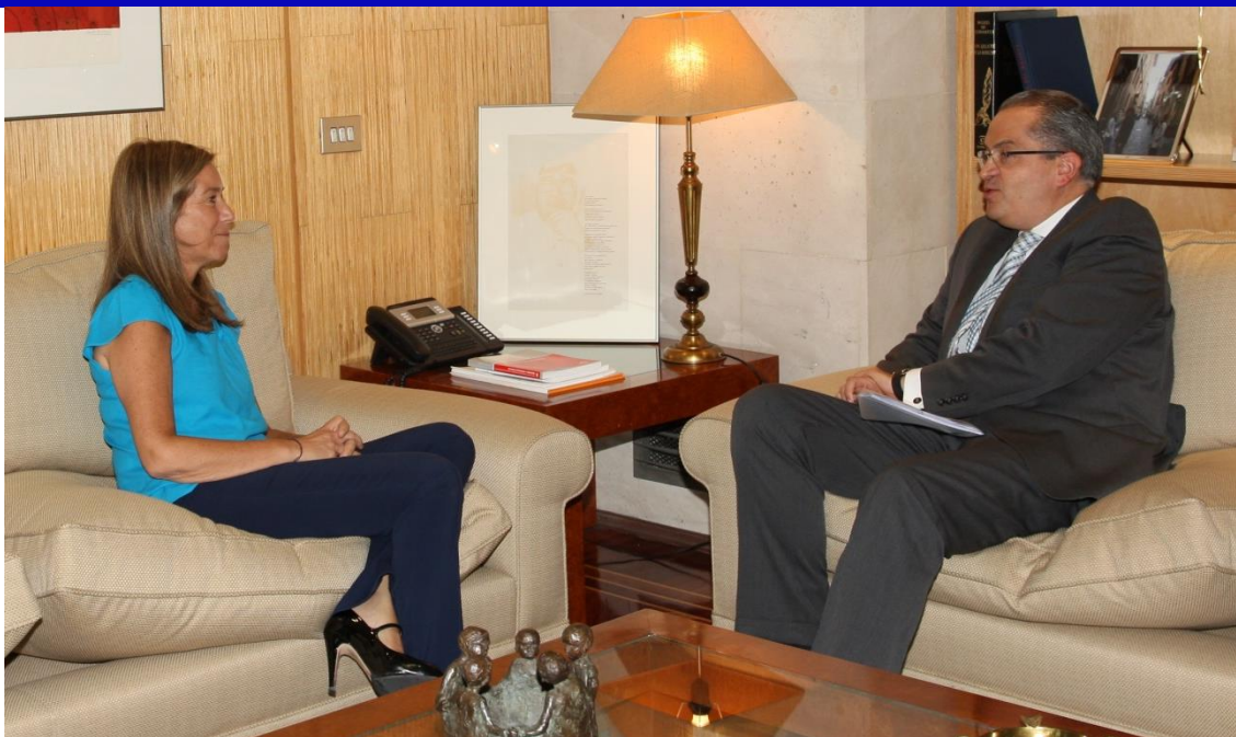
Embajador de Colombia, Fernando Carrillo y la Ministra de Sanidad, Ana Mato Adrover.

Madrid, 28 de julio 2014. El Embajador Carrillo se reunió con la Ministra de Sanidad, Servicios Sociales e Igualdad, Doña Ana Mato Adrover, con el fin de presentarle la situación en la que se encuentran cientos de médicos especialistas colombianos en España.