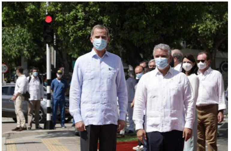
S.M. el Rey Felipe VI fue recibido con honores por el señor Presidente Duque. Barranquilla, diciembre 2021.

El rey Felipe VI visitó en compañía del Presidente Iván Duque el nuevo Puente Pumarejo, el más ancho de América Latina, construido en la ciudad colombiana de Barranquilla por la empresa española Sacyr.