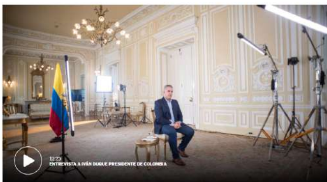
Entrevista del Presidente Iván Duque en El País, mayo de 2021

EL PAÍS entrevista al presidente colombiano en plena crisis de violencia. "Hoy nos tocó a nosotros, pero el estallido se va a repetir en muchos lugares del mundo". "Como presidente, no puedo renunciar al uso del estado de excepción". "Si pudiera volver atrás, buscaría un consenso más amplio"