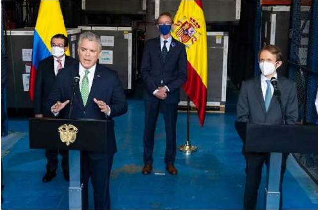
El Presidente Iván Duque recibió las vacunas contra el covid-19 donadas por el país ibérico, en la zona franca de Bogotá.