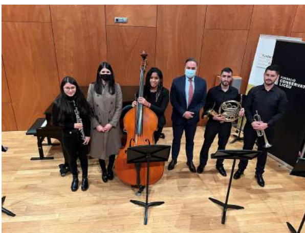
Reunión del señor Embajador con estudiantes del Conservatorio del Liceu, Barcelona, noviembre 2021.

De hecho, Colombia es el primer país beneficiario de las becas que ofrece anualmente la Fundación Carolina. Entre 2000 y 2019, se recibieron 2.971 becas. Y en la convocatoria de 2021 - 2022 se han registrado 29.208 candidaturas, de las cuales 8.022 proceden de Colombia, esto es un 27% del total de candidaturas.