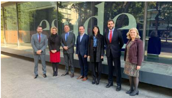
Reunión del señor Embajador con los directivos de ESADE, Barcelona noviembre 2021.

De hecho, Colombia es el primer país beneficiario de las becas que ofrece anualmente la Fundación Carolina. Entre 2000 y 2019, se recibieron 2.971 becas. Y en la convocatoria de 2021 - 2022 se han registrado 29.208 candidaturas, de las cuales 8.022 proceden de Colombia, esto es un 27% del total de candidaturas.