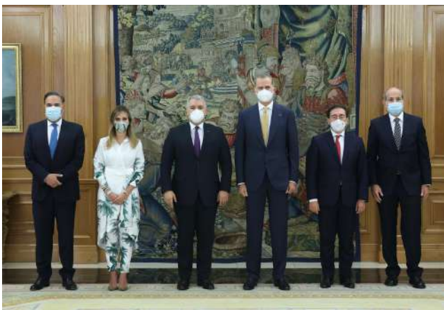
S.M. Felipe VI recibe al señor Presidente Duque en su Visita Oficial al Reino de España en septiembre de 2021.

S.M. el Rey reconoció «el gran paso admirable» que supone el estatuto y que convierte a Colombia en un referente en Iberoamérica: "Es una apuesta decidida y valiente por la dignidad y los derechos de cientos de miles de refugiados y migrantes que España reconoce y apoya".