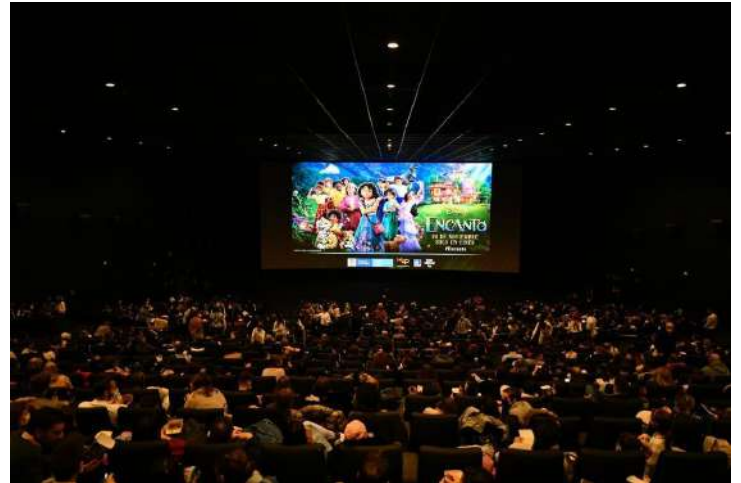
Premier Encanto, Cine Kinopolis, noviembre de 2021.

Colombia fue protagonista en la más reciente película de Disney “Encanto”. La casita madrigal, su magia, su música y los paisajes de esta nueva historia cautivaron a las más de mil personas que asistieron a los cines Kinopolis para el estreno organizado por Disney, la Embajada de Colombia y ProColombia.