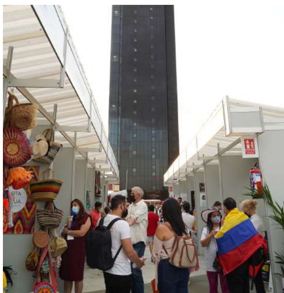
Feria de Emprendimiento realizada por el Consulado en Madrid, septiembre 2021.

Así mismo, se han realizado más de 70 visitas físicas a centros penitenciarios (además de las asistencias virtuales) para dar apoyo a los connacionales privados de la libertad.