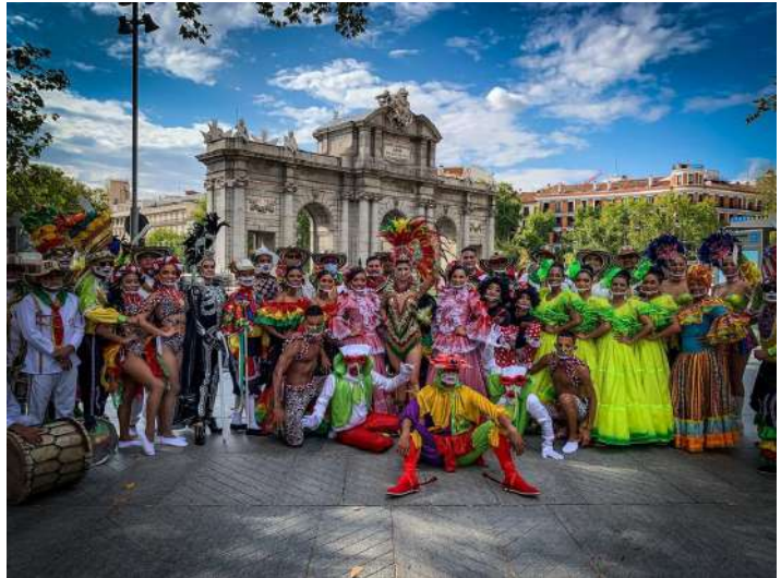
Carnaval de Barranquilla frente a la Puerta de Alcalá. Madrid, septiembre de 2021.

El Carnaval de Barranquilla, Patrimonio Cultural de la Humanidad, también estuvo presente en 2021 en Madrid, donde nacionales y extranjeros pudieron conocer y disfrutar de esta muestra ancestral, emblema de la costa caribe colombiana.