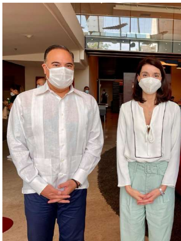
Encuentro del Embajador con la Ministra de Justicia de España, Pilar Llop, diciembre de 2021.

Así mismo, se logró la suscripción del Acuerdo para el intercambio y protección recíproca de información clasificada (APIC), por el cual se establecen las reglas y procedimientos para la seguridad de la información clasificada intercambiada entre España y Colombia.