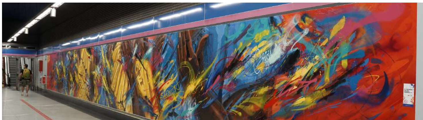
Mural El origen de las manos. Colectivo Vértigo Grafiti, noviembre 2021. Estación Colombia del Metro de Madrid.