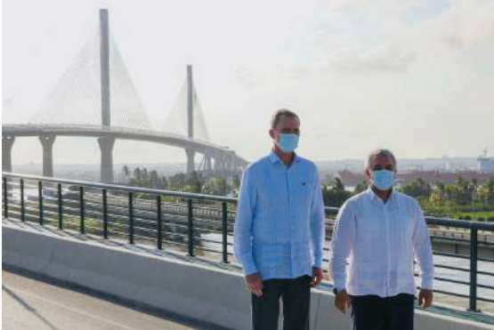
Rey Felipe VI y Presidente Iván Duque en el Puente Pumarejo, Barranquilla diciembre 2021.

"Es esta una ciudad que proyecta prosperidad, hacia el interior y el exterior, y que vuelve a recuperar su protagonismo como puerta de acceso a la Colombia contemporánea, moderna y pujante de nuestros días".