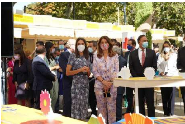
S.M. la Reina Doña Letizia visita el Pabellón Colombia en la Feria del Libro de Madrid 2021.

Durante 17 días , Colombia fue el invitado de honor en la 80ª versión de la Feria del Libro de Madrid, visitada por más de 300 mil personas. El Pabellón Colombia, ubicado estratégicamente a la entrada principal de la Feria, se constituyó en un espacio de encuentro entre los visitantes en el cual, mientras disfrutaban de una taza de café colombiano, pudieron acercarse a la diversidad geográfica, biológica, lingüística y cultural del país.