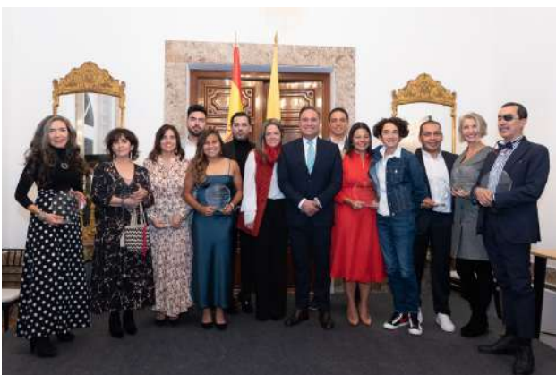
El Embajador Luis Guillermo Plata con los premiados en la ceremonia de "10 Colombianos destacados en España"; noviembre 2021.

El pasado 11 de noviembre y por sexto año consecutivo, fueron entregados por la Embajada los premios "10 colombianos destacados en España". En esta ocasión, los galardonados fueron deportistas, artistas, periodistas, chefs, empresarios y emprendedores que se han destacado por dejar en alto el nombre de nuestro país.