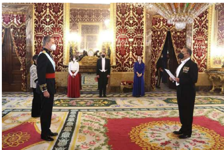
Presentación de cartas credenciales a S.M. el Rey Felipe VI.

Fortalecer los lazos diplomáticos y de amistad y por ende los comerciales, los de inversión y los de cooperación internacional en materias como la educación y la cultura, así como los que permiten tender puentes para un mejor entendimiento en temas judiciales, ha sido el objetivo del equipo de trabajo de la Embajada de Colombia en España durante el año 2021.