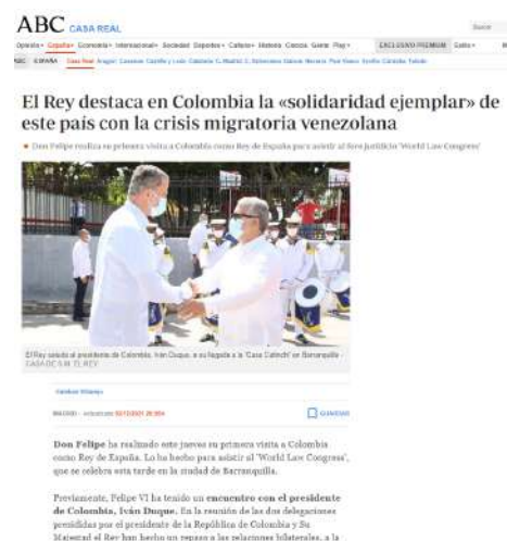
Artículo en el ABC, diciembre de 2021

Entre las principales temáticas de este año se encuentran: la Visita Oficial del Presidente Iván Duque a España, la presencia de Colombia como país invitado de honor en la Feria del Libro de Madrid, la Feria Internacional de Arte Contemporáneo (ARCO), el World Law Congress y el estreno de la más reciente película de Disney: Encanto.