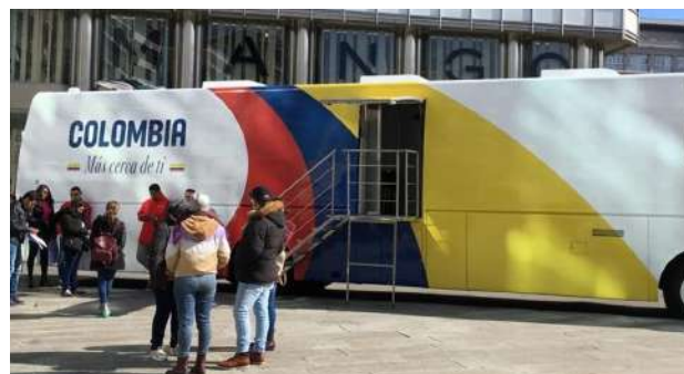
Consulado móvil en Ponferrada, León y Valladolid, noviembre de 2021.

Nuestros cónsules se han comprometido también con la prestación de más y mejores servicios con el desarrollo de más de 50 jornadas de horarios extendidos , así como con el establecimiento periódico de los sábados consulares .