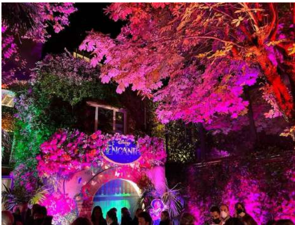
Centro Cultural Gabriel García Márquez, noviembre de 2021.