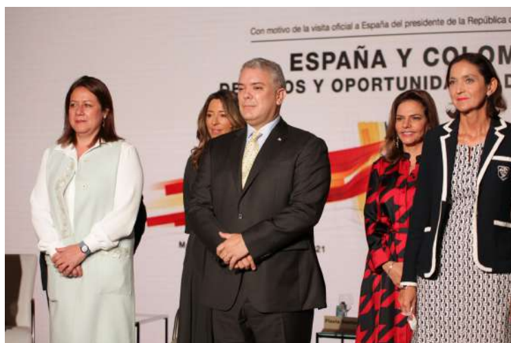
El señor Presidente inaugura el Foro Empresarial España - Colombia, septiembre de 2021, la CEOE, Cámara de Comercio de España, ICEX y ProColombia con el apoyo de la Embajada.

De hecho, durante la visita del señor Presidente Iván Duque a España, se anunciaron siete nuevos proyectos de inversión de capital español, por cerca de 2.500 millones de dólares.