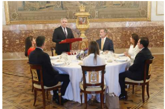
S.M. Felipe VI ofreció un almuerzo en honor al señor Presidente Duque en su Visita Oficial al Reino de España en septiembre de 2021.

En su encuentro oficial con Su Majestad El Rey Felipe VI, el Presidente Iván Duque Márquez hizo un reconocimiento a España por todo el apoyo para afrontar la pandemia del Covid-19 y, muy especialmente, por la donación de más de 1 millón de vacunas al país.