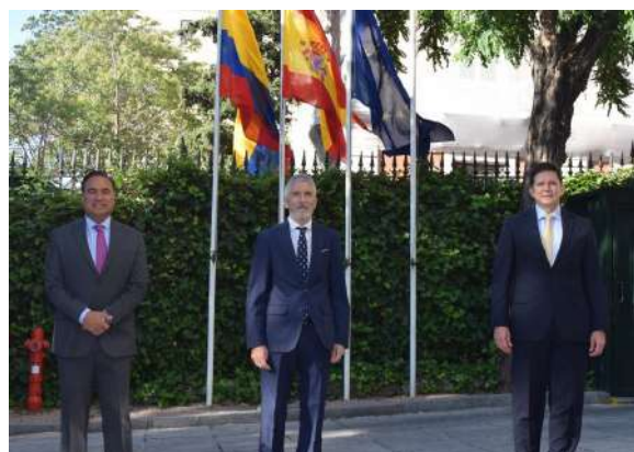
Reunión del señor Embajador con el Ministro del Interior de España, Fernando Grande - Marlaska y el Ministro de Justicia de Colombia, julio de 2021.

El Acuerdo establece las áreas de cooperación bilateral en materia de lucha contra la delincuencia y seguridad, especialmente en sus formas organizadas, en lo relacionado con delitos cibernéticos, trata de personas, comercio ilegal de armas, y delitos financieros incluido el blanqueo de dinero.