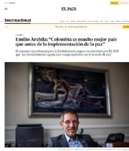
Entrevista del Consejero Emilio Archila en El País.

Este año en Twitter se lograron 419 publicaciones y en Instagram, 150. El trabajo en redes permitió un crecimiento positivo tanto en audiencia y sentimiento como en interacción.