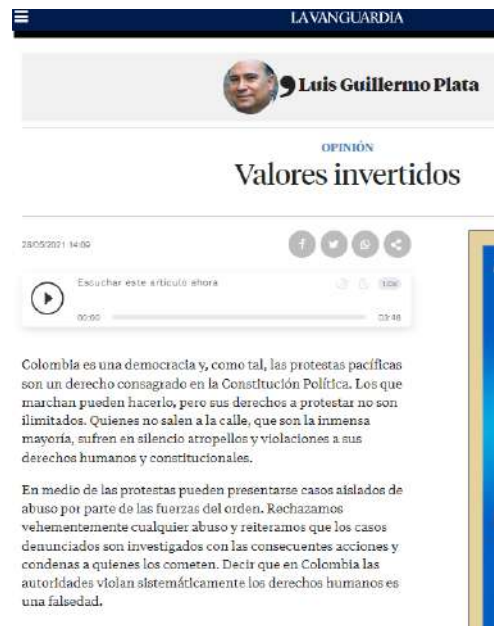
Columna en La Vanguardia, mayo de 2021

Lo anterior se traduce en la publicación de más de 380 noticias positivas gestionadas por la Embajada. Número que corresponde a un promedio mensual de 30 noticias divulgadas a través de free press.