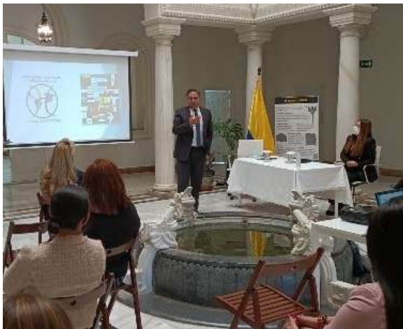
Reunión del señor Embajador con connacionales en el Consulado en Sevilla, octubre de 2021.

Una vez las normas sanitarias lo permitieron, con el fin de afianzar la presencia de Colombia en España, la Embajada realizó una serie de visitas a las comunidades autónomas y a las asociaciones de connacionales que tienen presencia en Madrid, Andalucía, Cataluña y Aragón, para conocer sus necesidades, atender sus inquietudes y tender puentes entre Colombia y la España, su patria de adopción.