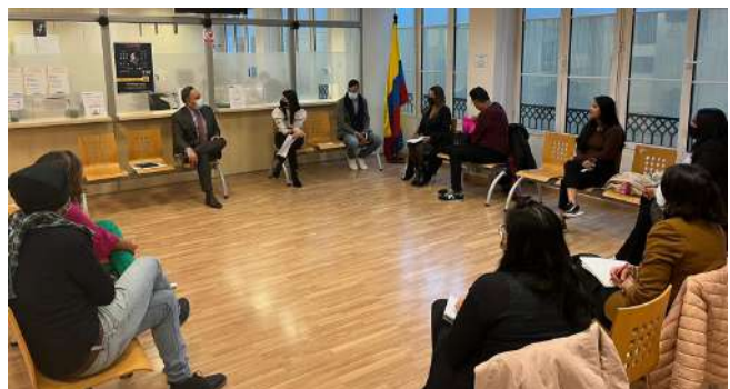
Reunión del señor Embajador con connacionales en el Consulado en Barcelona, noviembre de 2021.

Nuestros siete consulados en España han mantenido una labor constante de atención a nuestros connacionales a pesar de los retos que impone la situación sanitaria. Entre otras actividades, nuestras representaciones en las distintas comunidades autónomas han realizado más de 162.000 trámites consulares .