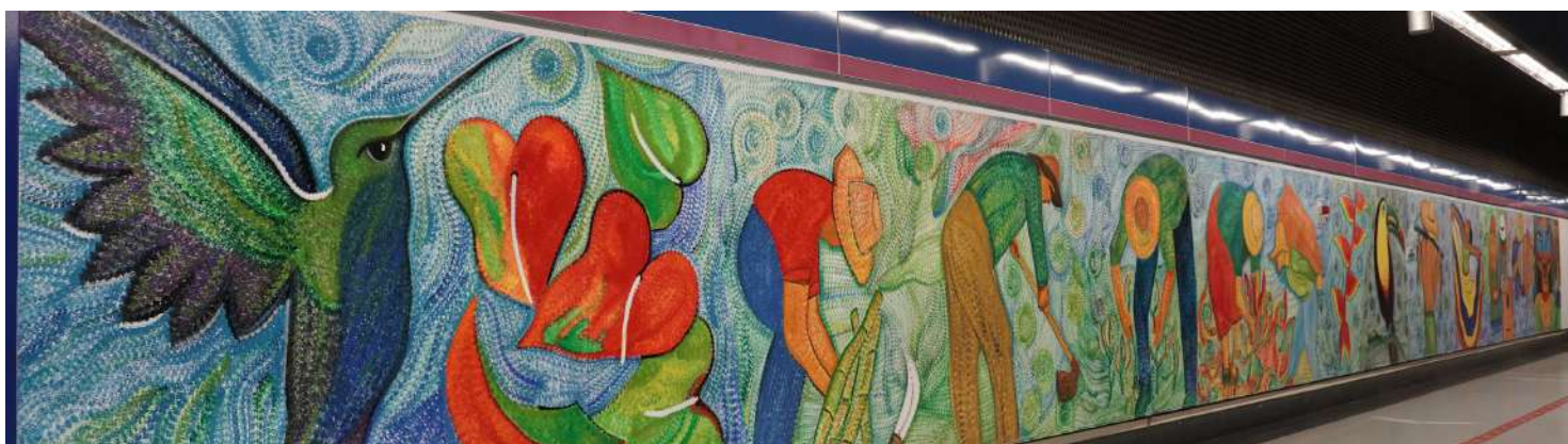
Mural Colombia diversa y vital. Gabriel Calle Arango, noviembre 2021. Estación Colombia del Metro de Madrid.