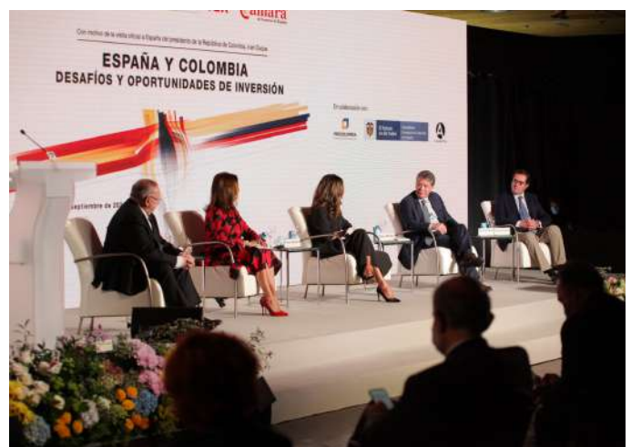
Foro Empresarial España - Colombia, septiembre de 2021, organizado por la CEOE, Cámara de Comercio de España, ICEX y ProColombia con el apoyo de la Embajada.

El nuevo APPRI recoge las tendencias mundiales en este tipo de materias y se constituye en un acuerdo de última generación.