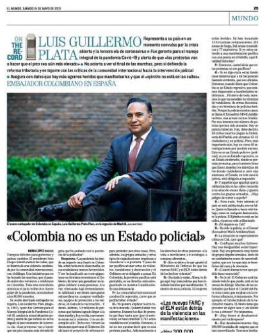
Entrevista para el diario EL MUNDO sobre las movilizaciones en Colombia.

Así mismo, la Embajada comenzó una importante campaña digital para acercar a la comunidad online. La estrategia incluyó el posicionamiento de la red social Twitter y el lanzamiento de la cuenta en Instagram.