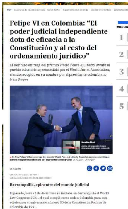
Artículo en La Razón, diciembre de 2021

Este alto número de noticias publicadas se debe, en gran medida, al relacionamiento estratégico que el Embajador y su equipo han mantenido con los medios en España, tendiendo siempre un puente de información con los directores, jefes de redacción, periodistas, entre otros actores importantes de las empresas y agencias de comunicación.