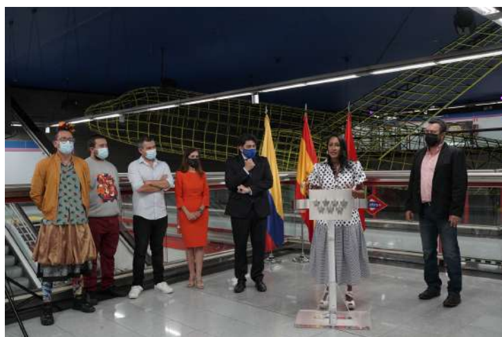
La Ministra de Cultura de Colombia, Angélica Mayolo, inaugura los murales de la Estación Colombia acompañada de los artistas, septiembre 2021.

En la estación “Colombia” del metro de Madrid hay dos nuevos murales inspirados en la diversidad de nuestro país, realizados uno por el Colectivo Vértigo, que cuenta con obras similares en más de diez naciones, y otro, por Gabriel Calle Arango, quien acaba de terminar su última obra en Nueva York. Hoy, luego de la intervención, la emblemática estación tiene una verdadera identidad colombiana.