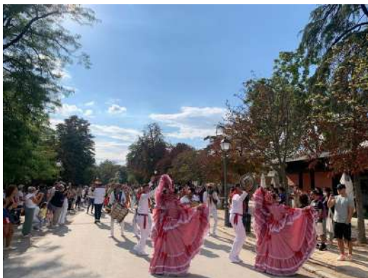
Desfile del Carnaval por el parque de El Retiro. Madrid, septiembre de 2021.

La reina del Carnaval de Barranquilla y más de 40 artistas, entre bailarines y músicos, realizaron diferentes shows en los puntos icónicos de la capital española. El Carnaval llegó con toda su alegría para llenar de color esta gran celebración literaria que tuvimos en septiembre en la capital española.