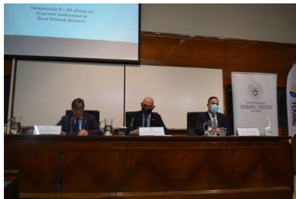
Inauguración 3ª edición Programa Becas Belisario Betancur, Universidad Complutense de Madrid, noviembre 2021.

La educación es uno de los pilares fundamentales de la relación de España con Colombia. A través de la Embajada este año fueron concertadas reuniones con universidades españolas, así como con la Fundación Carolina para propiciar que más colombianos tengan acceso a tales instancias.