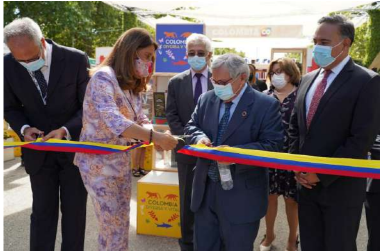
La Vicepresidente y Canciller de Colombia Marta Lucía Ramírez inauguró la Feria del Libro de Madrid 2021, en la que Colombia fue el país invitado de honor.

La Librería Colombia vendió más de 2.200 ejemplares de múltiples autores y diferentes géneros literarios, que viajaron directamente desde Colombia para la Feria.