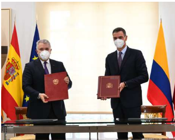
Suscripción del Acuerdo entre los presidentes Duque y Sánchez, durante la Visita Oficial del Presidente Iván Duque al Reino de España, septiembre 2021.

Durante la estadía del señor Presidente en Madrid, junto con el Presidente de Gobierno español, Pedro Sánchez, se puso en marcha la Comisión de Alto Nivel (CAN) la cual busca profundizar la relación y elevar el nivel de interlocución entre ambas naciones.