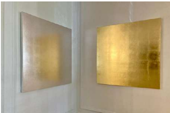
Exposición Geodesia de Edwin Monsalve, Residencia del Embajador, julio de 2021.

Exposición GEODESIA del artista colombiano Edwin Monsalve en la residencia del Embajador con ocasión del circuito VIP de la Feria Internacional de Arte Contemporáneo ARCO.