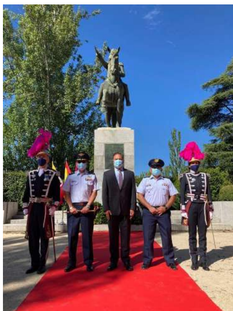
Ofrenda floral con motivo del 20 de julio.

A través del instrumento, España y Colombia fortalecerán el intercambio de información y la asistencia técnica con el fin de brindar asesorías, capacitaciones, intercambiar experiencias y buenas prácticas y demás actividades de interés común que permitan el fortalecimiento de capacidades a las partes.