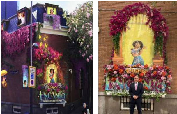
Fachada de la Embajada de Colombia en Madrid, noviembre de 2021.