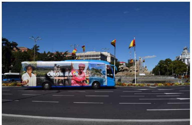
Los buses de Colombia recorrieron la capital madrileña durante la Feria del Libro de Madrid.

Colombia contó con la participación de 33 autores y se llevaron, mediante cuatro ejes temáticos, cerca de 80 actividades entre conversatorios, conferencias, talleres y exhibiciones de cine, no solamente en nuestro pabellón, sino también en otros pabellones de la Feria y en lugares como la Casa de América, la Fundación Ortega y Gasset, entre otros.