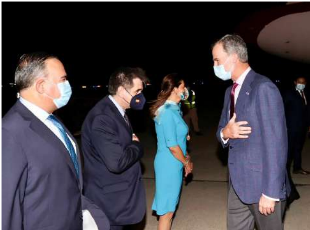
Recibimiento a S.M. el Rey Felipe VI, Barranquilla diciembre 2021.

En dicho evento la Asociación Mundial de Juristas (WJA) rindió homenaje internacional a Colombia, concediéndole el Premio mundial a la Paz y la Libertad, el más importante del mundo dentro del ámbito jurídico. Anteriormente el premio lo recibieron Sir Winston Churchill, Nelson Mandela, Rene Cassin, S.M. el Rey Felipe VI de España o la Justice Ruth Bader Ginsburg, magistrada de la Suprema Corte de los Estados Unidos.