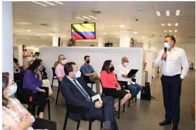
Reunión del señor Embajador con connacionales en el Consulado en Madrid, junio de 2021.

Igualmente, han salido de su sede física para realizar 40 consulados móviles que les han permitido a los connacionales que viven retirados de la sede física del consulado realizar más de 13.700 trámites .