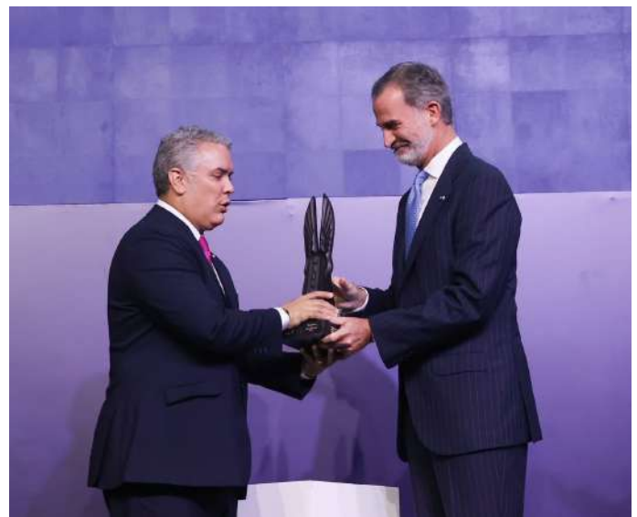
S.M. el Rey Felipe VI hace entrega al pueblo colombiano, en cabeza del señor Presidente, del premio Paz y Libertad. Barranquilla, diciembre 2021.

No había mejor manera de culminar el año 2021 que con la celebración del Congreso Mundial del Derecho en la ciudad de Barranquilla con más de 2 mil juristas, presidentes de Altas Cortes, Magistrados y, por supuesto, Su Majestad el Rey Felipe VI.