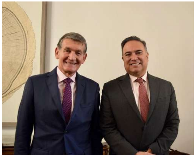
Reunión del señor Embajador con el Ministro de Trabajo de Colombia, Ángel Custodio Cabrera, quien participó en Madrid en la Conferencia Iberoamericana de Ministras y Ministros de Trabajo, octubre 2021.

Para la comunidad de colombianos en España, un tema muy importante es el Convenio Multilateral Iberoamericano de Seguridad Social que recientemente fue aprobado por el Congreso de la República de Colombia y está muy próximo a entrar en funcionamiento. Esto permitirá que las semanas trabajadas en Colombia se puedan acumular a las semanas trabajadas en España para efectos de acceder a los beneficios de la pensión.