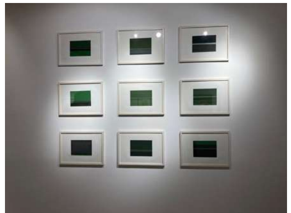
Exposición Abstracciones, seis artistas colombianos. Centro Cultural Gabriel García Márquez, julio de 2021.